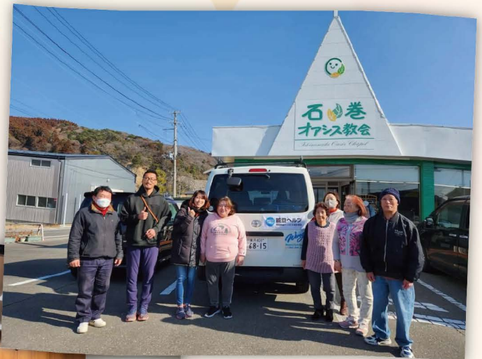
↑ 石巻オアシス教会