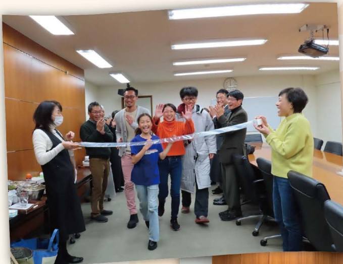
↑ AC サポートチーム →